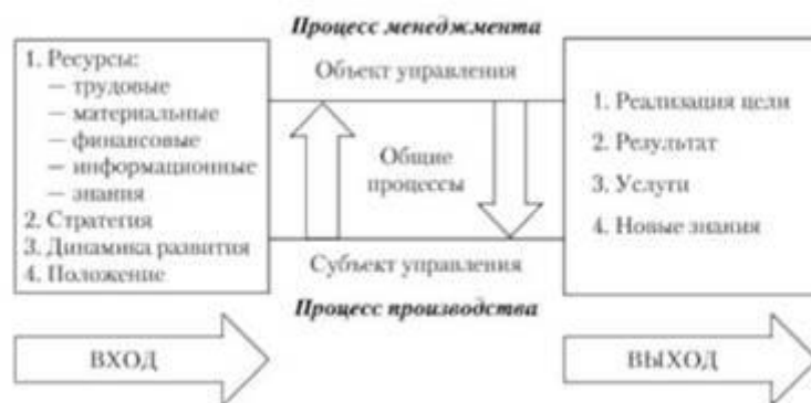
Рис. 1. Система менеджмента в организации

Традиционно отношения управления рассматривают как воздействие субъекта на объект. Вместе с тем объект находится в тесном взаимодействии с субъектом и не только реагирует на воздействие последнего, но и сам воздействует на субъект управления по принципу «мудростью тоже надо управлять».