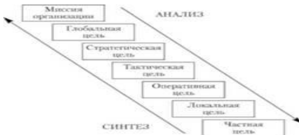
Рис. 5. Модель дерева целей организации

Миссия отражается как в средствах массовой информации, так и в бизнес-плане, годовом отчете и других