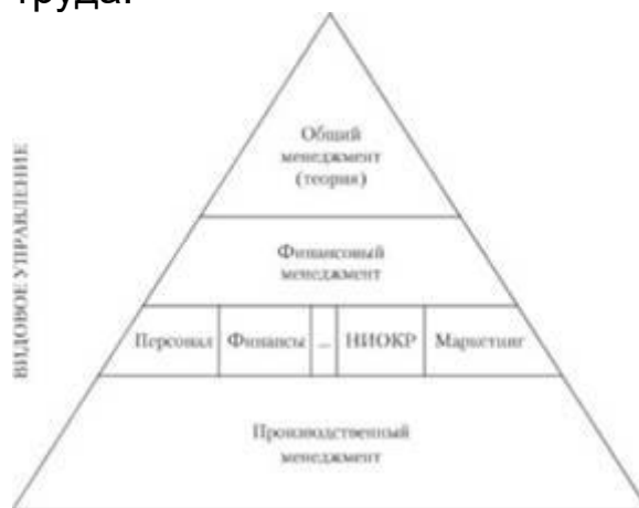
Рис. 4. Видовая характеристика менеджмента

Важной составляющей при освоении курса является выработка теоретико-методологического взгляда на менеджмент, рассмотрение общего менеджмента как системы обобщенных упорядоченных знаний об управлении социально-экономическими или производственно-хозяйственными системами. Так, теория менеджмента включает законы, принципы, функции, организационные структуры и формы, процесс менеджмента, которые детально рассматриваются в других разделах настоящего труда.