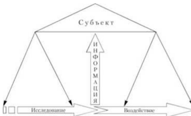
Рис. 9. Объединение исследований и воздействий менеджмента

В представленной на рис. 9 общей модели построения и реализации такого объединения выделяется причинно-следствен