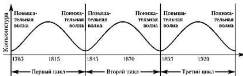
Рис. 11. Длинные волны Н. Д. Кондратьева

Следовательно, характер фазы большого цикла не может не отразиться на ходе средних циклов. Так, если наблюдать понижительный период большого цикла, то все повышательные тенденции средних циклов будут ослаблены, а понижительные тенденции будут усиливаться общей понижительной волной большого цикла.