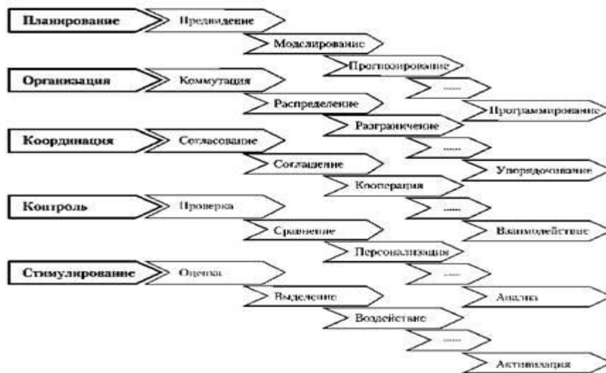
Рис. 8. Классификация общих функций менеджмента