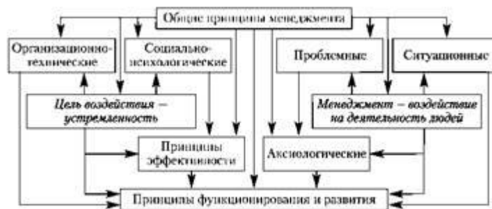
Рис. 7. Классификация принципов менеджмента

Представленная на рис. 7 схема описывает исключительное разнообразие принципов менеджмента: научные и прагматические, общие и частные, функциональные и комплексные, организационные и методологические, принципы ограничений и принципы