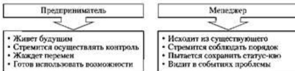
Рис. 13. Приоритеты предпринимателя и менеджера

Но если без собственника бизнес нежизнеспособен, профессионалом такого собственника не назовешь. Профессиональный собственник не связан по рукам и ногам своим бизнесом, он выстраивает взаимодействие с менеджерами организации. Собственник может выжимать максимум дохода из одного бизнеса или иметь средний доход от нескольких различных предприятий. Именно во втором варианте предприниматель может получать значительно больший личный доход при меньших затратах личного времени. При таком подходе бизнес рассматривается как инвестиция. Собственник выступает в роли инвестора и первоочередное внимание направляет не на то, чем будет заниматься бизнес, а на его финансовую составляющую.