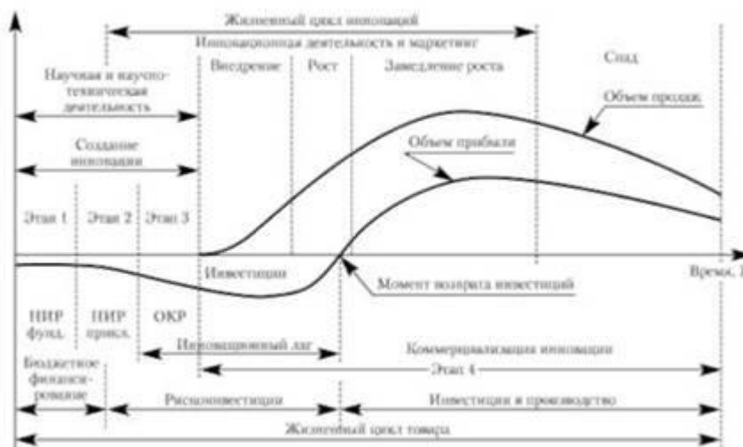
Рис. 12. Схема жизненного цикла продуктовых инноваций

Жизненный цикл технологии производства также складывается из четырех фаз. Первая фаза связана с зарождением нововведений-процессов и осуществляется путем проведения широкого круга научно-исследовательских работ (НИР)