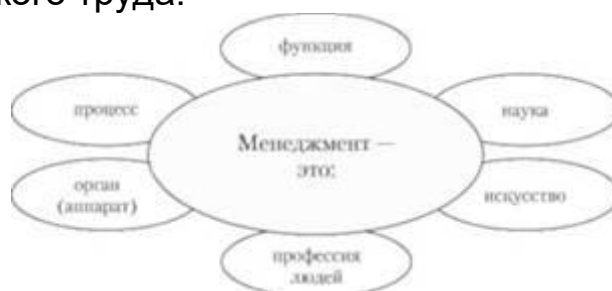
Рис. 3. Проявления менеджмента

Общий менеджмент есть обобщение, рассматриваемое как теория. Общий менеджмент наиболее тесно взаимосвязан с функциональным и производственным (объектным) менеджментом. Первый представляет собой специализированное руководство, возникшее в результате разделения и специализации управленческого труда.